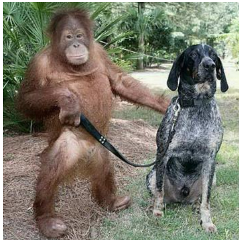
C'est beau l'amitié... !