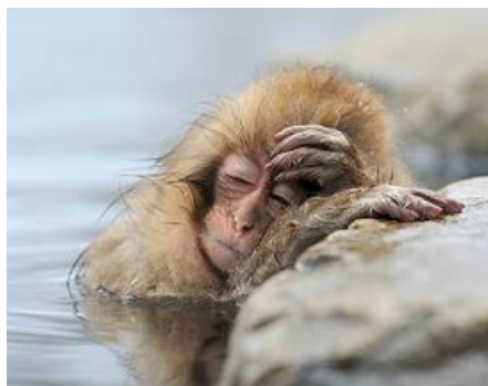
Lendemain de fête au zoo...