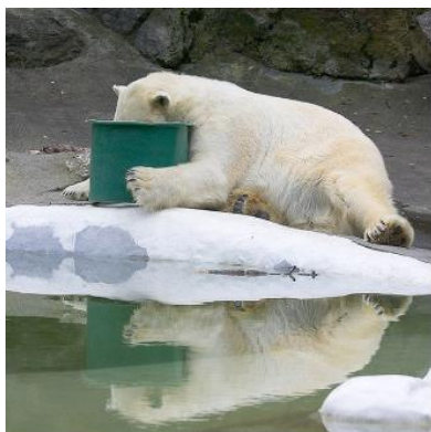
La photo du mois...